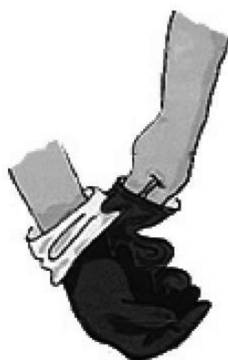
c) 用已脱下的手套袖口捏紧另一只手套袖口