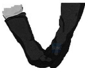
a) 将其中一只手套从指尖处拉下

B.2.2 防护手套使用过程中沾染上有害有毒物质无法重复使用时,可参照图 B.1 的方法依序脱掉防护手套,避免接触皮肤和衣服,造成二次污染。