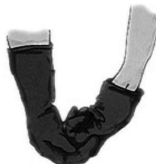
b) 边脱下手套边将脱下部分揉成球状